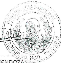
PROFRA. MIRIAM RAMÍREZ MENDOZA PRESIDENTA MUNICIPAL CONSTITUCIONAL